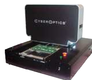
卓上型外観検査装置 QX100